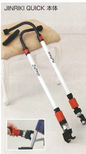
JINRIKI QUICK 本体