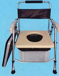
簡易トイレ設置時