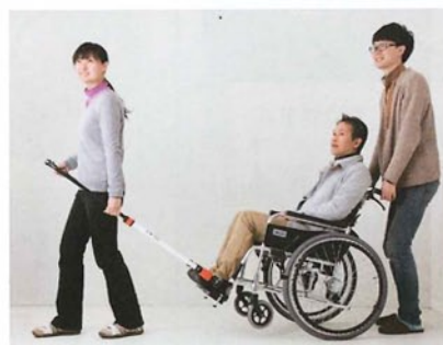
JINRIKI QUICK 本体

重さ約15.2kgの軽量、座幅420mmのゆったりサイズ。エアータイヤの中にポリウレタンを入れたノーパンクタイヤを使用していますので室内外で快適・スムーズにお使いになれます。ワンタッチ操作で収納も簡単。 フレーム/アルミ製 座幅/約420mm タイヤ/ノーパンク 22インチ 使用時寸法/幅約625×長980×高875mm 折りたたみ時/約350×970×670mm 格納時(箱入)/約340×960×740mm 本体価格 ¥93,000 (非課税商品)