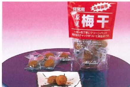
↑梅干 (賞味期限5年) [2410] 人体に必要な塩分の補給に役立ちます。12粒入 本体価格 ¥480+税 20