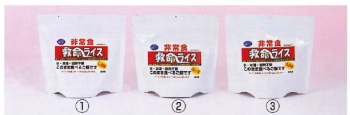
↑救命ライス (賞味期限5年) お米を揚げた軽い口当たりの即席ライス。インフラが寸断された状況下でも水無し・加熱不要で、そのまま美味しく食べられ、スープやシチューの具等さまざまなお料理にも利用できます。1袋/100g ①しお [2561] ②カレー [2563] ③うめ [2565] 本体価格 各¥380+税 40

※「春陽」は体に吸収されやすいタンパク質「グルテリン」の含量が他のお米に比べて約1/2という特長を持ったお米です。