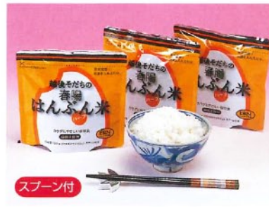
↑はんぶん米 (賞味期限5年) [2550] 湯または水を注ぐだけで、美味しいご飯ができます。新開発の「春陽」を原料米とした体にやさしいアルファ化米です。添加物、加工助剤を一切使用していない安全なお飯です。100g(1食分) 湯または水の必要量/160ml(1食) 本体価格 ¥380+税 50

※「春陽」は体に吸収されやすいタンパク質「グルテリン」の含量が他のお米に比べて約1/2という特長を持ったお米です。