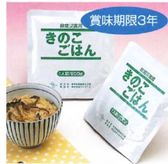
賞味期限3年 ↑きのこごはん [2520] 200g(1食分) 本体価格 ¥380+税 30