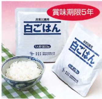
賞味期限5年 ↑白ごはん [2510] 200g(1食分) 本体価格 ¥300+税 80

熱湯で温めるだけで、美味しく食べられる手軽な保存食品。普通のレトルト食品より、はるかに長期保存ができます。新しい美味しさが加わった各種ご飯は、保存安全性の高い特殊フィルムのパック入りで、開封後そのまま容器として使用できます。食事の支度と後片付けが簡単ということは非常用食品としての重要な条件です。