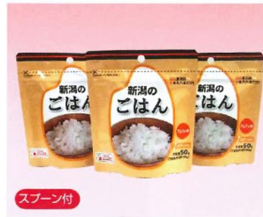
↑新潟のごはん(50g) (賞味期限5年) [2548] でき上がりはお茶碗1杯程度。高齢者やお子さま、女性向きの食べきりサイズのアルファ化米です。食べ残しも減らせます。50g(1食分)、でき上がり150g(茶碗1杯分) 湯または水の必要量/100ml(1食) 本体価格 ¥240+税 50