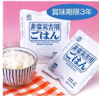
賞味期限3年 ↑非常災害用ごはん [2515] 170g(1食分) 本体価格 ¥220+税 10