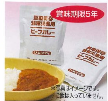
賞味期限5年 ↑ビーフカレー [2540] 200g(1食分) 本体価格 ¥250+税 30