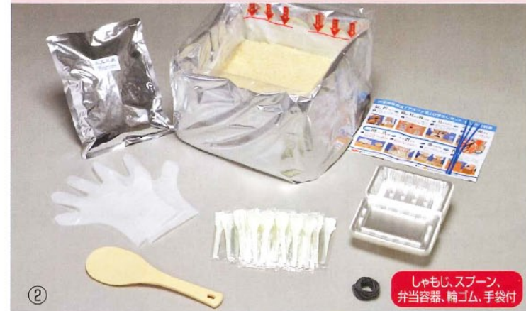
② ↑アルファ米 (賞味期限5年) 湯または水を注ぐだけで、いつでも、どこでも美味しいご飯が食べられます。軽くて、かさばらないので運搬にも便利で、キャンプや運動会などのイベントにも最適です。 ※注 ②5kgは50食分を一度につくるセットです。1食分ずつ小分けにされていません。 湯または水の必要量/ドライカレー、チキンライス、えびピラフ、白飯、五目ごはん、わかめごはん、松茸ごはん、田舎ごはん 160ml(100gあたり) 赤飯、山菜おこわ 110ml(100gあたり)